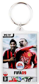
Référence CR-70 / 2 faces 75 x 52,5 mm Dimension : 70 x 45 mm Assemblage manuel Outil à couper : MC-70C