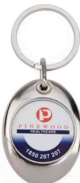
Référence M6 - 1 face Ø 25 mm Dimension : 43 x 32,5 mm Assemblage C25 Outils à couper : UC-25R / MC-25R Outil d'assemblage : UM-MZ CARRO