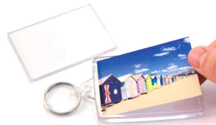
Référence CR-45 / 2 faces 35 x 45 mm Dimension : 55 x 42 mm Assemblage manuel Outil à couper : MC-35C