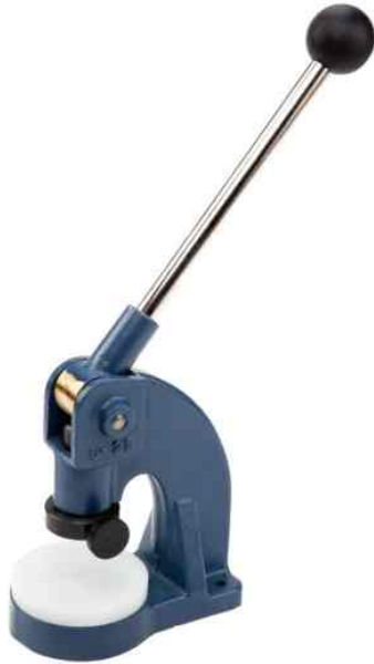
Machine de découpe Référence C-25 2 fonctions : - couper le papier avec différentes matrices - assembler les porte-clés