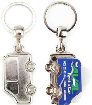
Référence MV - 1 face Dimension : 50 x 28 mm Assemblage C25 Outil à couper : MC-V Outil d'assemblage : UM-V