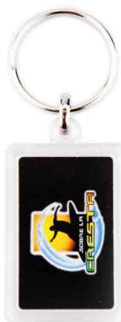
Référence CR-40 / 2 faces 25 x 40 mm Dimension : 52,5 x 31 mm Assemblage manuel Outils à couper : UC-40 / MC-40C