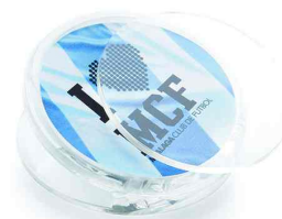
Référence Magnet pince frigo MAG-PZ 1 face Ø 51 mm Dimension : Ø 58 mm Assemblage manuel Outils à couper : T38 / Ct38 / CM-500