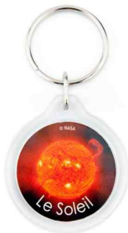
Référence CR-33 / 2 faces Ø 33 mm Dimension : 60 x 37 mm Assemblage manuel Outils à couper : UR-33R / MC-33R