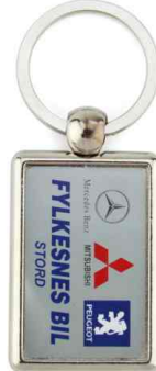
Référence ML-40 / 1 ou 2 faces 25 x 40 mm Dimension : 49 x 30 mm Assemblage C25 Outils à couper : UC-40C / MC-40C Outil d'assemblage : UM-40