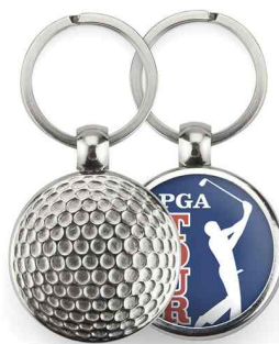
Référence MGF - 1 face Ø 30 mm Dimension : 45 x 35 mm Assemblage C25 Outils à couper : UC-30R / MC-30R Outil d'assemblage : UM-FT