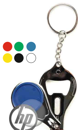
Référence CU-25R - 1 face Ø 25 mm Dimension : 63 x 35 mm Assemblage manuel Outils à couper : UC-25R / MC-25R