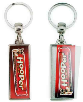
Référence MA-18 - 2 faces 18 x 15 mm Dimension : 62,5 x 25 mm Assemblage C25 Outils à couper : UC-18 / MC-18C Outil d'assemblage : UM-MA-18