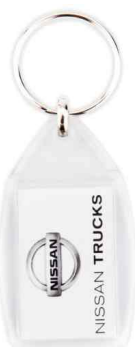
Référence CF-40 / 2 faces 30 x 40 mm Dimension : 60 x 35,5 mm Assemblage manuel Outils à couper : UC-40 / MC-40C