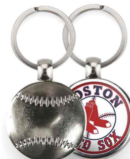
Référence MBB - 1 face Ø 30 mm Dimension : 45 x 30 mm Assemblage C25 Outils à couper : UC-30R / MC-30R Outil d'assemblage : UM-FT