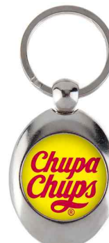
Référence MZ25 - 1 face Ø 25 mm Dimension : 43 x 32,5 mm Assemblage C25 Outils à couper : UC-25R / MC-25R Outil d'assemblage : UM-MZ CARRO