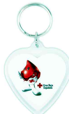
Référence CR-COR / 2 faces Dimension : 48 x 41 mm Assemblage manuel Outil à couper : MC-COR