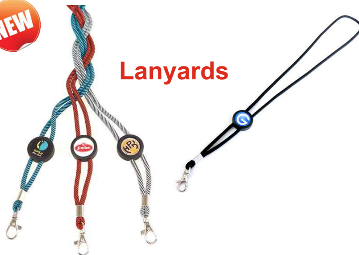
Lanyard Référence LAN-25 1 face Ø 25 mm Assemblage manuel Outil à couper : UC-25R / MC-25R 4 couleurs (noir, bleu, blanc, rouge)