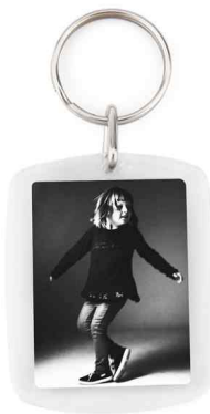
Référence CR-30 / 2 faces 30 x 40 mm Dimension : 43 x 32,5 mm Assemblage manuel Outil à couper : MC-30C