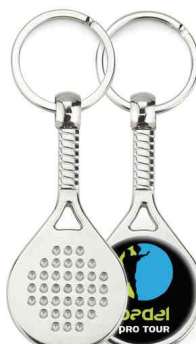
Référence MPD - 1 face Ø 25 mm Dimension : 65 x 32 mm Assemblage C25 Outils à couper : UC-25R / MC-25R Outil d'assemblage : UM-TN