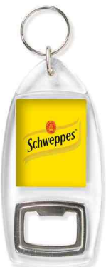
Référence CR-AB / 2 faces Assemblage manuel Outil à couper : MC-AB

L'assemblage des porte-clés en acrylique se fait manuellement en capsulant la fenêtre en plastique. A partir de 3000 pièces, nous pouvons réaliser les impressions et assemblages en respectant les couleurs pantone.