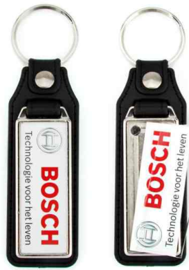
Référence MD-18 - 1 face 18 x 50 mm Dimension : 83 x 28 mm Assemblage C25 Outils à couper : UC-18 / MC-18C Outil d'assemblage : UM-MD18