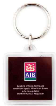
Référence CR-32 / 2 faces 32 X 32 mm Dimension : 45 x 39 mm Assemblage manuel Outils à couper : UC-32 / MC-32C