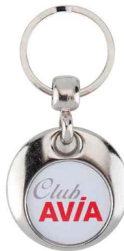
Référence MT-25D - 2 faces Ø 25 mm Dimension : 36 x 36 mm Assemblage C25 Outils à couper : UC-25R / MC-25R Outil d'assemblage : UM-MT