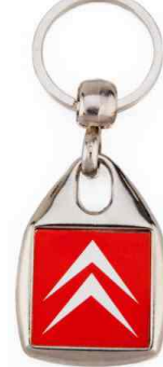
Référence MF-25 / 1 ou 2 faces 25 x 25 mm Dimension : 45 x 32 mm Assemblage C25 Outils à couper : UC-25 / MC-25C Outil d'assemblage : UM-MF