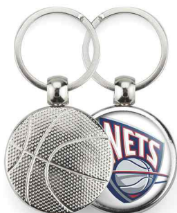
Référence MBK - 1 face Ø 30 mm Dimension : 45 x 35 mm Assemblage C25 Outils à couper : UC-30R / MC-30R Outil d'assemblage : UM-FT