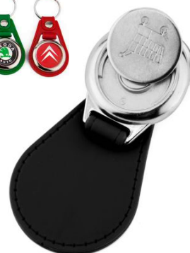
Référence MD-25 JETON - 1 face Ø 25 mm Dimension : 61 x 39 mm Assemblage C25 Outils à couper : UC-25R / MC-25R Outil d'assemblage : UM-MD25