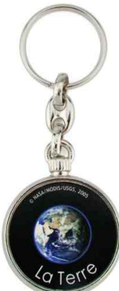
Référence MO-33D - 2 faces Ø 33 mm Dimension : 48 x 36,5 mm Assemblage C25 Outils à couper : UC-33R - MC-33R