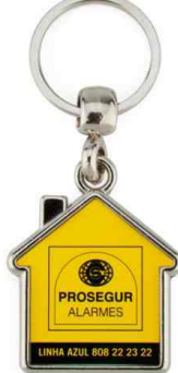
Référence MY / 1 ou 2 faces Dimension : 48 x 39,5 mm Assemblage C25 Outil à couper : MC-Y Outil d'assemblage : UM-MY