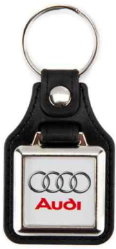
Référence MD10 - 1 face 25 x 25mm Dimension : 60 x 38 mm Assemblage C25 Outils à couper : UC-25C / MC-25C Outil d'assemblage : UM-MD10