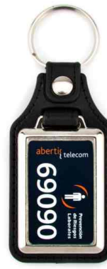
Référence MD-40 - 1 face 25 x 40 mm Dimension : 75 x 38,5 mm Assemblage C25 Outils à couper : UC-40 / MC-40C Outil d'assemblage : UM-MD40