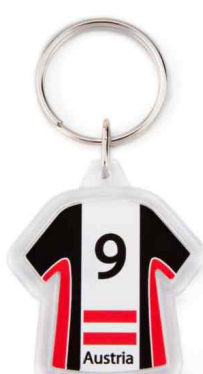
Référence CR-X / 2 faces Dimension : 48 x 41 mm Assemblage manuel Outil à couper : MC-X