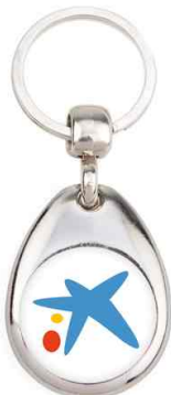
Référence MH25 - 1 face Ø 25 mm Dimension : 43 x 33 mm Assemblage C25 Outils à couper : UR-25R - MC-25R Outil d'assemblage : UM-MH CARRO