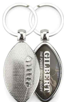
Référence MRB - 1 face 43 x 24 mm Dimension : 43 x 24 mm Assemblage C25 Outil à couper : MC-RB Outil d'assemblage : UM-RB