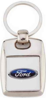
Référence MK 25 - 2 faces 25 x 25 mm Dimension : 43 x 33 mm Assemblage C25 Outils à couper : UC-25C / MC-25C Outil d'assemblage : UM-MK