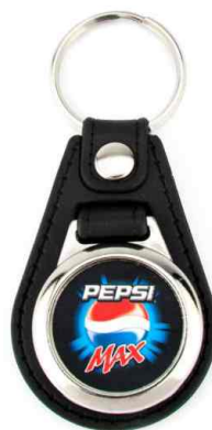
Référence MD-25 - 1 face Ø 25 mm Dimension : 61 x 39 mm Assemblage C25 Outils à couper : UC-25R / MC-25R Outil d'assemblage : UM-MD25