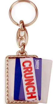
Référence MG-40 / 1 ou 2 faces 25 x 25 mm Dimension : 25 x 40 mm Assemblage C25 Outils à couper : UC-40 / MC-40C Outil d'assemblage : UM-40