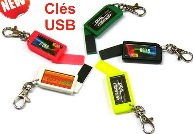
Clé USB 1Go Référence USB-36 1 face 36 x 18 mm Dimension : 60 x 37 mm Assemblage manuel Outil à couper : MC-36C 10 couleurs