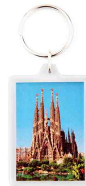
Référence CR-50 / 2 faces 35 x 50 mm Dimension : 63 x 42,5 mm Assemblage manuel Outils à couper : UC-50 / MC-50C