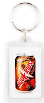
Référence CK-40 / 2 faces 25 x 40 mm Dimension : 52,5 x 31 mm Assemblage manuel Outils à couper : UC-40 / MC-40C