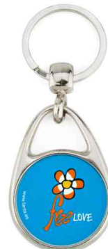
Référence MS-30D - 2 faces Ø 30 mm Dimension : 49 x 35 mm Assemblage C25 Outils à couper : UC-30R / MC-30R Outil d'assemblage : UM-MS