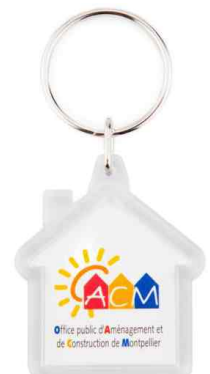
Référence CR-Y / 2 faces Dimension : 47 x 41 mm Assemblage manuel Outil à couper : MC-Y