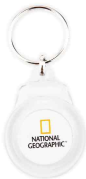
Référence CR-18 / 2 faces Ø 25 mm Dimension : 60 x 37 mm Assemblage manuel Outils à couper : UC-25 / MC-25C