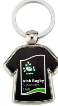
Référence MX-D / 2 faces Dimension : 49 x 39 mm Assemblage C25 Outil à couper : MC-X Outil d'assemblage : UM-MX