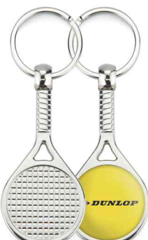
Référence MTN - 1 face Ø 25 mm Dimension : 65 x 32 mm Assemblage C25 Outils à couper : UC-25R / MC-25R Outil d'assemblage : UM-TN