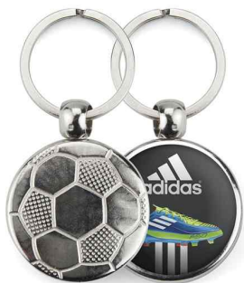
Référence MFT - 1 face Ø 30 mm Dimension : 45 x 35 mm Assemblage C25 Outils à couper : UC-30R / MC-30R Outil d'assemblage : UM-FT

Nous proposons différents types de conditionnement du produit. L'emballage standard est de 100 pièces par lot, en passant par un emballage individuel dans un sac à fermeture automatique jusqu'à un emballage entièrement personnalisé et sur-mesure à partir de 100. A partir de 3000 pièces, nous pouvons personnaliser un dessin sur une face d'un jeton. Le résultat est un porte-clé plus personnalisé qui transmet mieux l'image de marque.