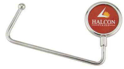
Référence CB-30 / 1 face Dimension : 107 x 65 mm Assemblage C25 Outils à couper : UC-30R / MC-30R Outil d'assemblage : UM-CB