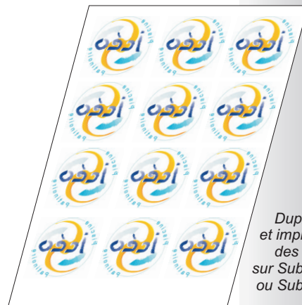
Duplication et impression des visuels sur Sublipaper ou Sublipaper Plus

*La zone maximum de marquage dépend également des dimensions du plateau de la presse à transfert utilisée.